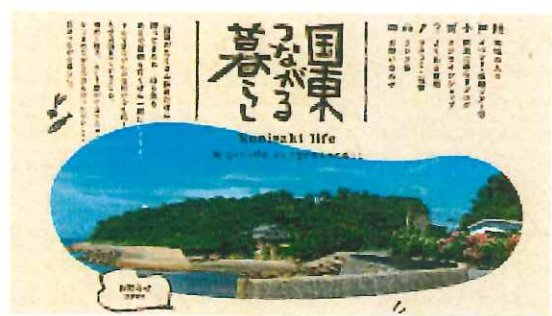
共通 WEB サイト “国東つながる暮らし” トップページ

地域づくり支え合い活動の可視化によって、現在は、いつまでも誰もが安心して生活がおくれるよう、高齢・過疎化が進む中でスマホ取扱いデジタル対策に向けて買物支援や移動支援、通院支援、防災などで SNS 等を含めた情報の一括管理が行えるシステムづくりについても検討をしており、多方面での効果が期待される取組を行っている。