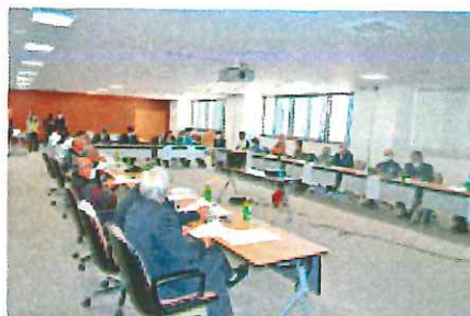
寄ろう会では、各団体の代表が集まり、情報共有・課題等を協議している。

「国東つながる暮らし」は各種イベントによる関係人口の拡大やECサイトでの地域経済の向上の仕組みも実装され、今後のウィズコロナの状況もよく勘案されている。国東のそれぞれの地域の自主性と自律性がメディアから立ち起こり、より協力的なコミュニティへと発展していくこの伸びやかさに、今後も期待している。