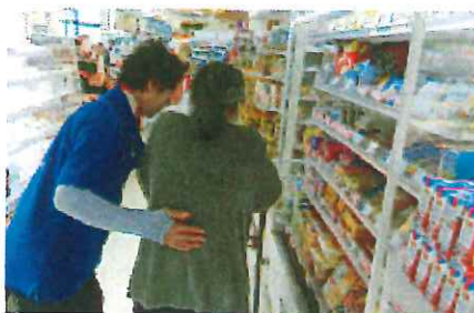
支え合い活動（居場所づくりから誕生した生活支援）