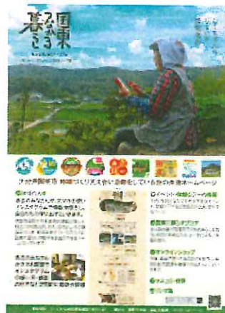
共通WEBサイト「国東つながる暮らし」ポスター