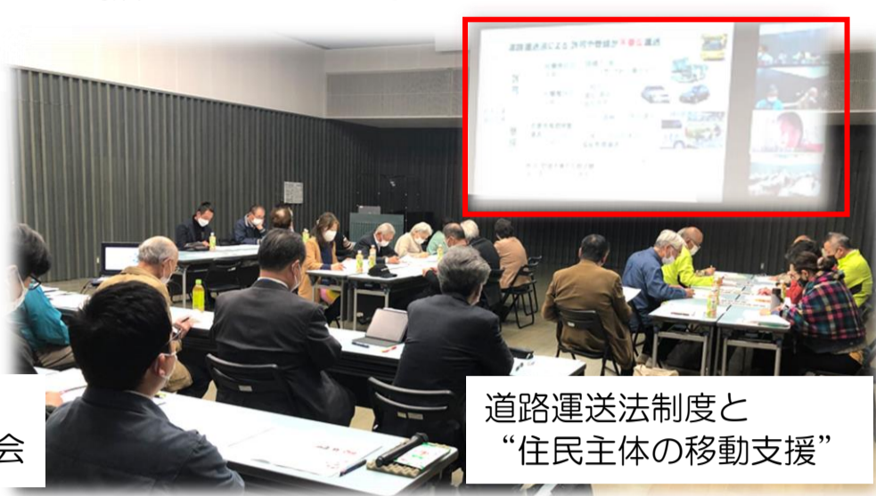
道路運送法制度と “住民主体の移動支援”

今年度3回目の寄ろう会も、コロナ感染に配慮し参集範囲を縮小しての開催となりました。本来であればより多くの方にご出席いただきたいと思いましたが、今回もこの様な形での開催および報告となりました。