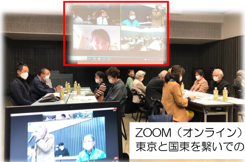
ZOOM（オンライン）で 東京と国東を繋いでの 学習会

日時：令和5年3月22日（水）14：00～16：15 場所：アストくにさき マルチホール